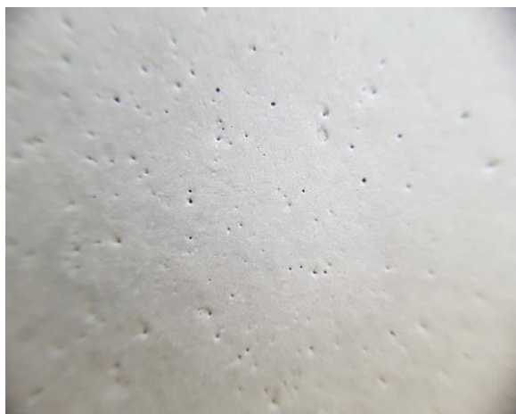
Antimousse de la concurrence à hautes performances

Comparaison entre des antimousses dans un mortier autonivelant standard au même dosage