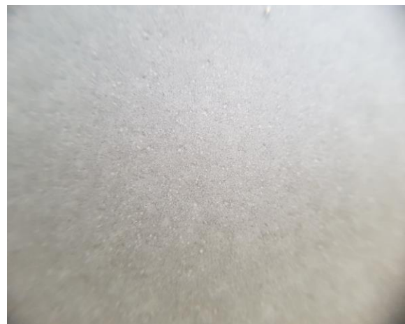
Antifoam PS 5